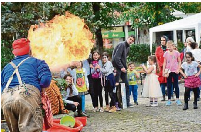
Im Rahmenprogramm wurde eine beeindruckende Feuershow geboten.