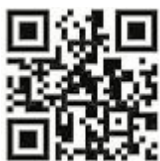
Der QR-Code im Oktober

Vom 13. bis 24. November findet eine Ausstellung zum Thema „Mobilität in der Me-